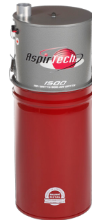
1500 PUISSANCE INSONORISÉ