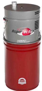
4000 SURPUISSANCE INSONORISÉ