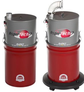
Disponible avec chariot 500 CONDO INSONORISÉ