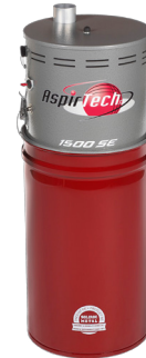
1500 SE PUISSANCE INSONORISÉ