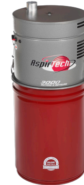
3000 PUISSANCE INSONORISÉ